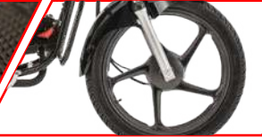
AROS DE ALEACIÓN QUE SE PUEDEN USAR SIN CÁMARA