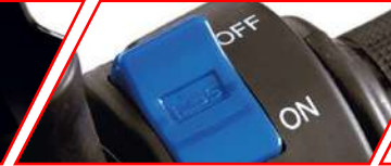
TECNOLOGÍA i3S PARA AHORRO DE COMBUSTIBLE