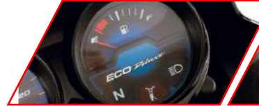
MEDIDOR DE COMBUSTIBLE